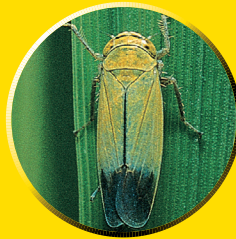
ツマグロヨコバイ