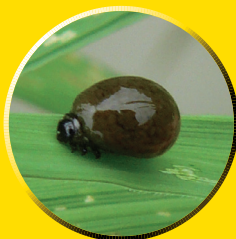
イネドロオイムシ