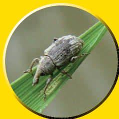
イネミズゾウムシ