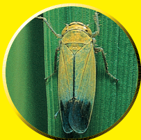
ツマグロヨコバイ