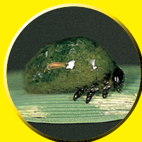
イネドロオイムシ