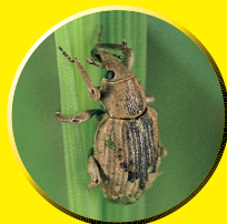
イネミズゾウムシ