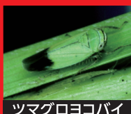
ツマグロヨコバイ