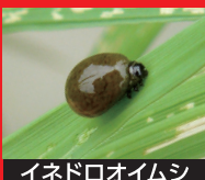
イネドロオウムシ