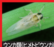
ウンカ類(ヒメビウカ)