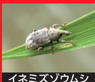
イネミズゾウムシ