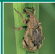
イネミズゾウムシ