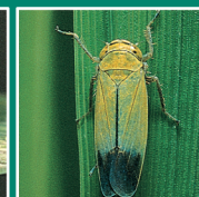
ツマグロヨコバイ