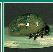
イネドロオイムシ