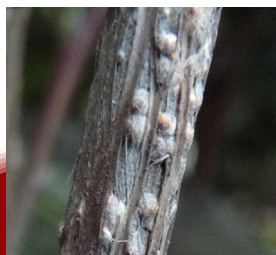
クワシロカイガラムシ