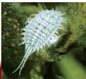
クワコナカイガラムシ