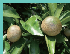
ミカンサビダニ被害