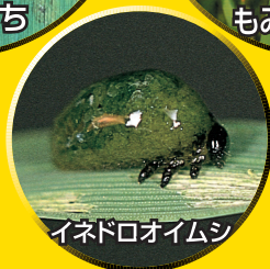
イネドロオウムシ