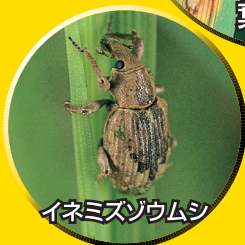
イネミズゾウムシ