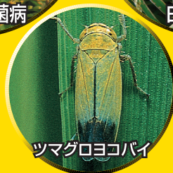
ツマグロヨコバイ